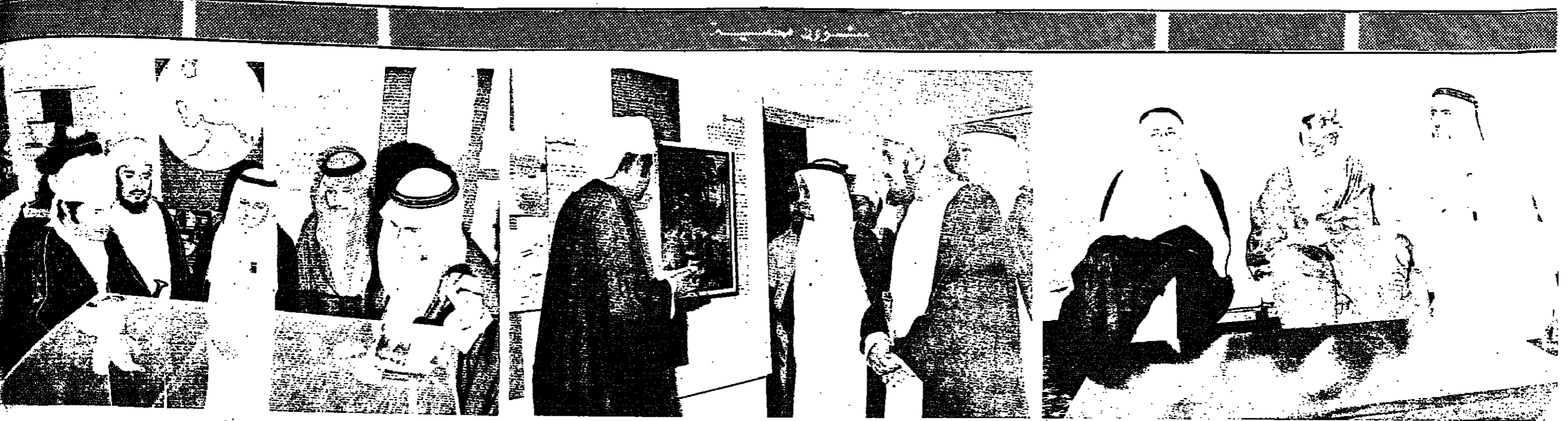
معالي السيد هلال بن حمد السمار وزير العدل اثناء استقباله معالي الشيخ عبد الوهاب احمد عبد الواسع وزير الحج والاعراف السعودي ، ومعالي الضيف السعودي اثناء زيارته للمتحف العماني